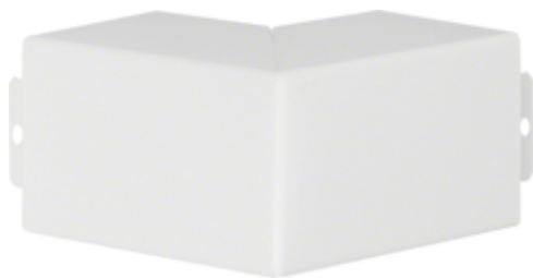
tehalit.LFS Kąt zewnętrzny, 60x60mm, biały