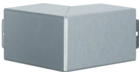
tehalit.LFS Kąt zewnętrzny, 60x60mm, ocynkowany