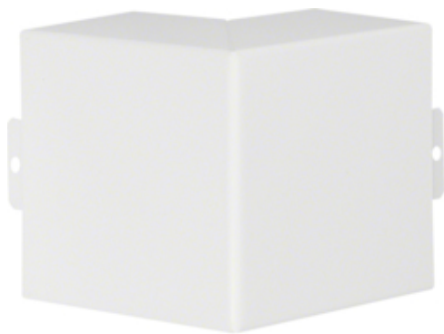
tehalit.LFS Kąt zewnętrzny, 60x100mm, biały