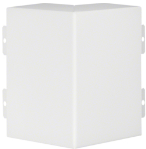
tehalit.LFS Kąt zewnętrzny, 60x150mm, biały