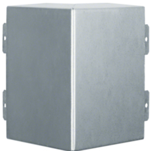
tehalit.LFS Kąt zewnętrzny, 60x150mm, ocynkowany