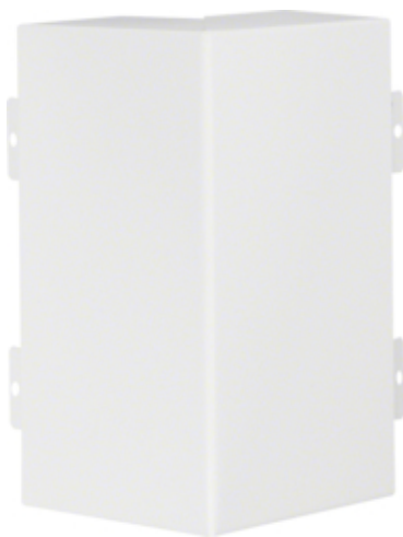
tehalit.LFS Kąt zewnętrzny, 60x200mm, biały