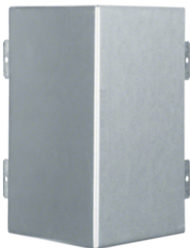
tehalit.LFS Kąt zewnętrzny, 60x200mm, ocynkowany