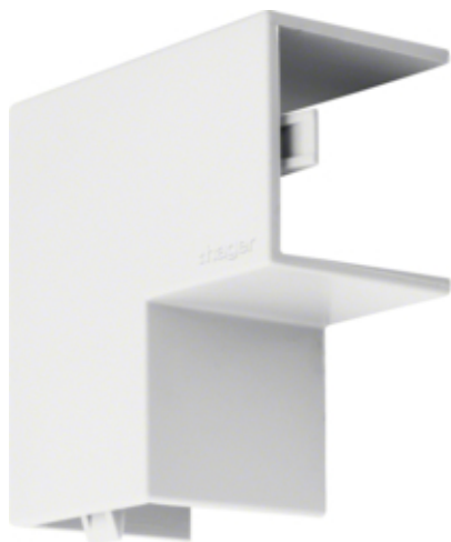
tehalit.LF Kąt płaski 25x25mm, biały