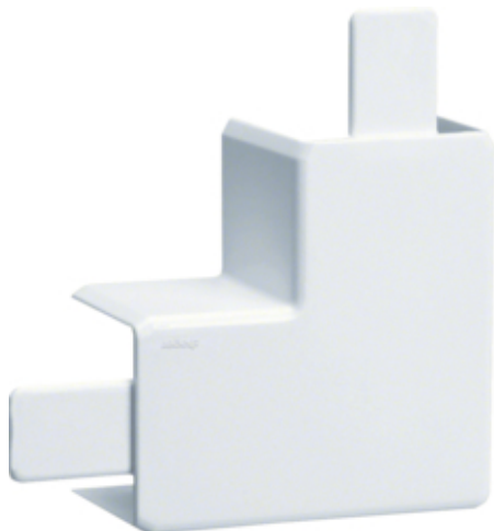
tehalit.LF/ateha Kąt płaski 40x40mm biały