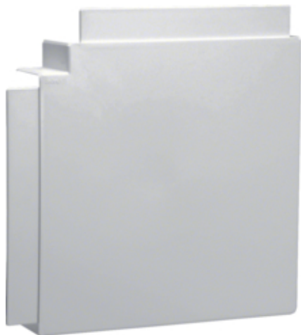
tehalit.LF Kąt płaski, 60x230mm, jasnoszary