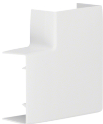
tehalit.LF/LFF Kąt płaski 30x60mm, biały