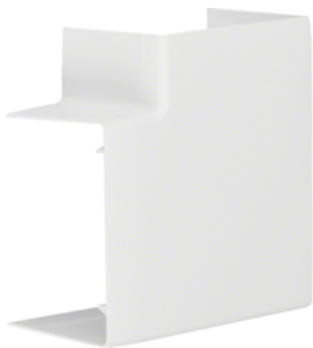
tehalit.LF/LFF Kąt płaski 60x90mm, biały