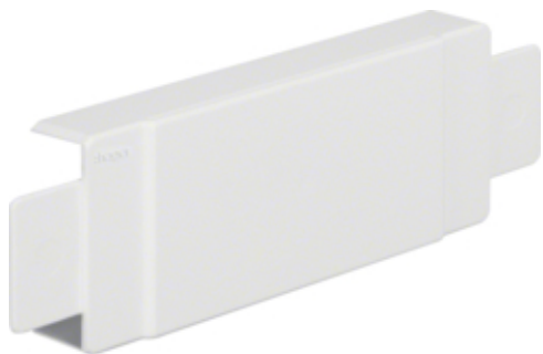
tehalit.LF Element T/X 18x45mm biały