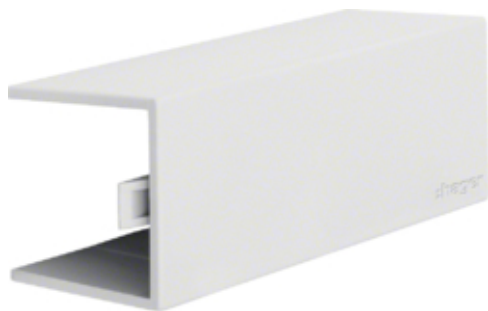
tehalit.LF Element T/X 25x25mm, biały