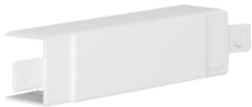
tehalit.LF/ateha Element T/X 30x30mm biały