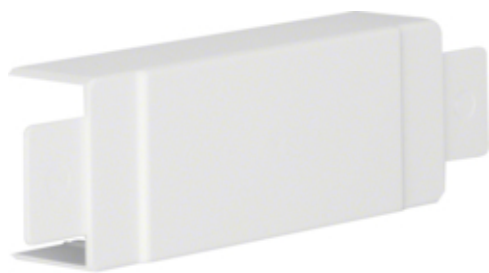
tehalit.LF Element T/X 30x45mm biały