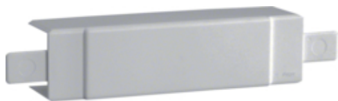
tehalit.LF/ateha Element T/X 40x40mm jasnoszary