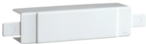
tehalit.LF/ateha Element T/X 40x40mm biały