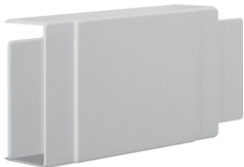
tehalit.LF Element T/X, 40x90mm, jasnoszary