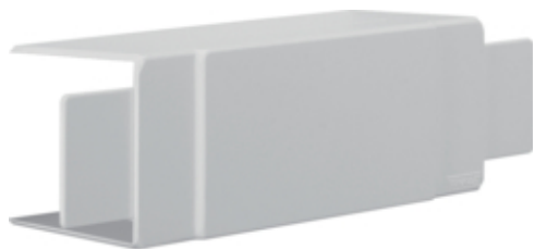
tehalit.LF Element T/X, 60x60mm, jasnoszary