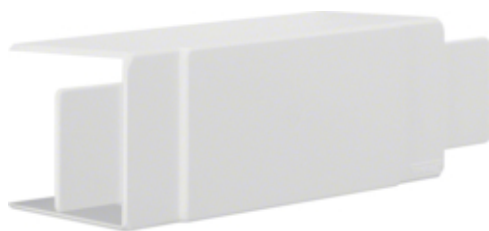
tehalit.LF Element T/X, 60x60mm, biały