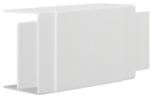
tehalit.LF Element T/X, 60x90mm, biały