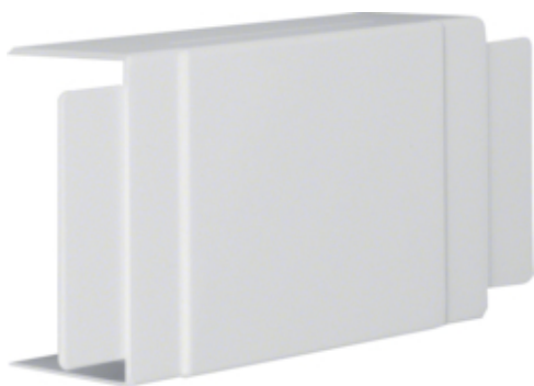
tehalit.LF Element T/X, 60x110mm, jasnoszary