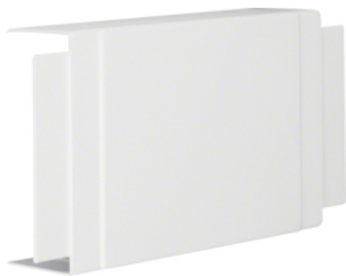
tehalit.LF Element T, 60x150mm, biały