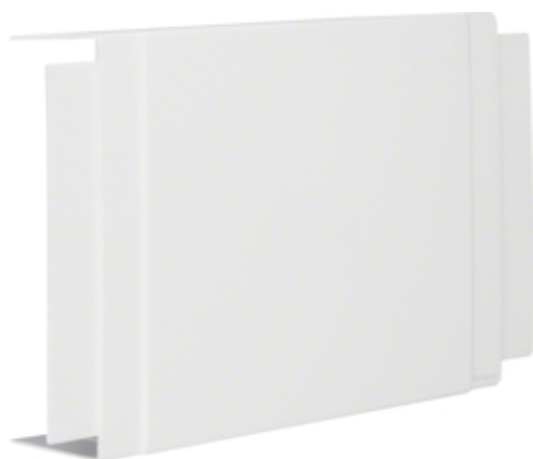
tehalit.LF Element T i krzyżak, 60x190mm, biały