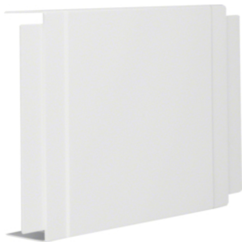
tehalit.LF Element T i krzyżak, 60x230mm, biały