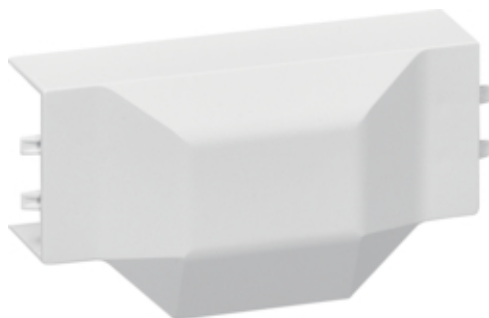
tehalit.LF Element T/X 20x35/36mm biały