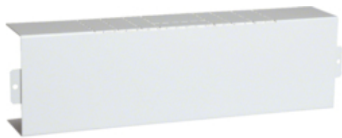
tehalit.LFS Element T, 60x100mm, biały