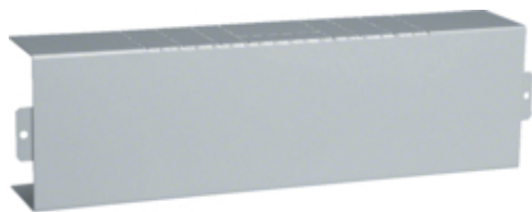
tehalit.LFS Element T, 60x100mm, ocynkowany