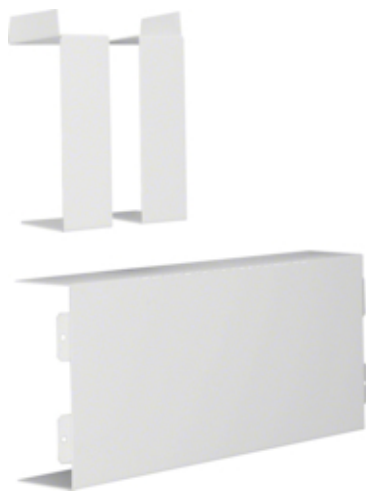
tehalit.LFS Element T, 60x150mm, biały