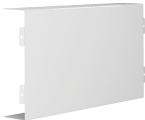
tehalit.LFS Element T, 60x200mm, biały