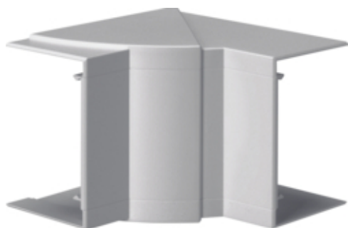
tehalit.BR65/BRS Kąt wewnętrzny 65x100, PC-ABS, jasnoszary