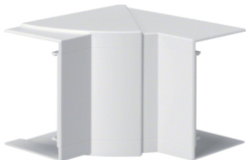
tehalit.BR65/BRS Kąt wewnętrzny 65x100, PC-ABS, biały