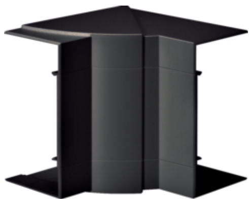
tehalit.BRN65/ BR65 Kąt wewnętrzny 65x130, czarny