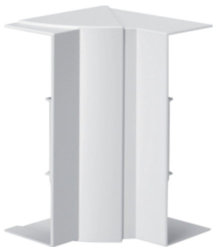
tehalit.BRN65/ BR65 Kąt wewnętrzny 65x210, biały