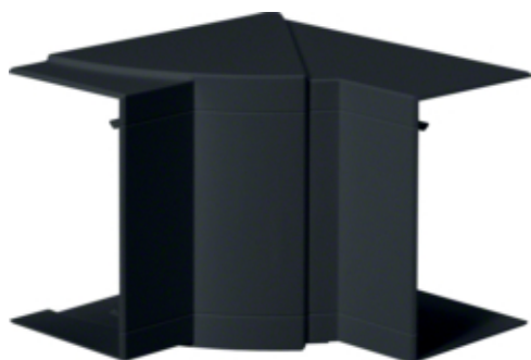
tehalit.BRP/BRAP Kąt wewnętrzny 65x100 czarny