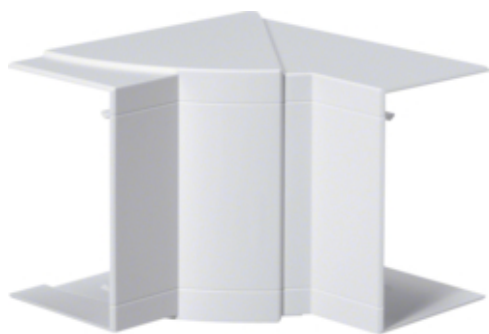
tehalit.BRP/BRAP Kąt wewnętrzny 65x100, biały