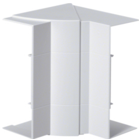
tehalit.BRP/BRAP Kąt wewnętrzny 65x170, biały