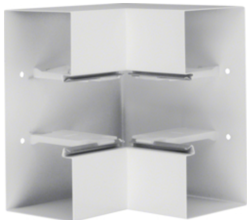
tehalit.BRS Kąt wewnętrzny 100x210 stal biały