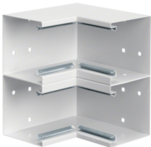
tehalit.BRS Kąt wewnętrzny 100x210 D stal biały