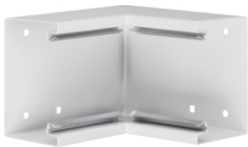
tehalit.BRS Kąt wewnętrzny 65x100, stalowy, biały