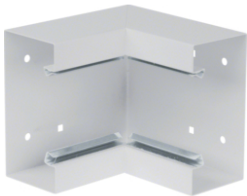
tehalit.BRS Kąt wewnętrzny 65x130, stalowy, jasnoszary