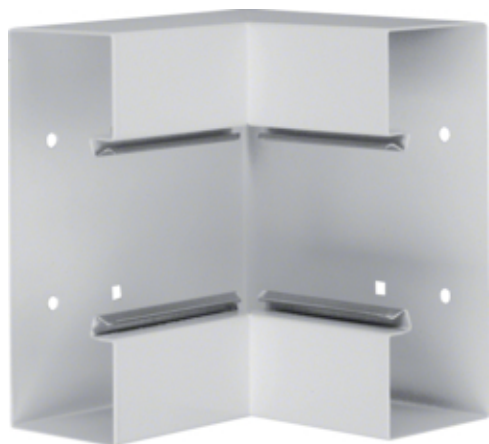
tehalit.BRS Kąt wewnętrzny 65x170, stalowy, jasnoszary