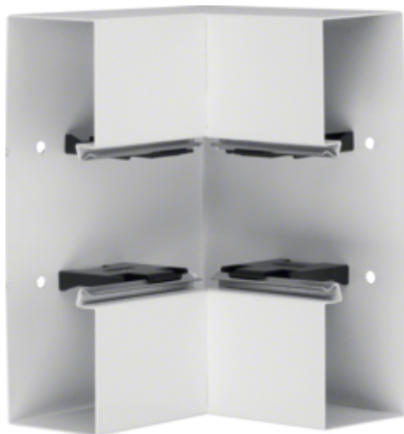
tehalit.BRS Kąt wewnętrzny 65x210 stalowy, biały