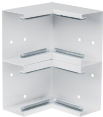
tehalit.BRS Kąt wewnętrzny 65x210 D, stalowy, biały