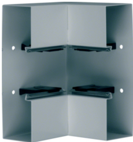
tehalit.BRS Kąt wewnętrzny 65x210, stalowy, ocynkowany