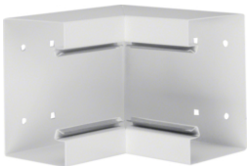
tehalit.BRS Kąt wewnętrzny 85x130 stal biały