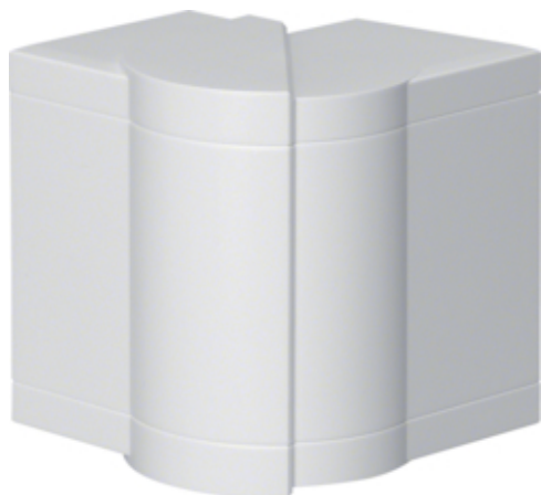
tehalit.BR65/BRS Kąt zewnętrzny 65x100, PC-ABS, biały