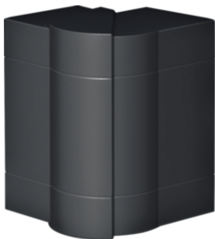
tehalit.BRN65/ BR65 Kąt zewnętrzny 65x130, czarny