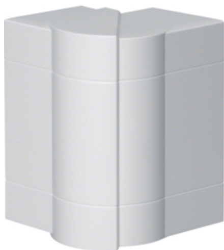
tehalit.BRN65/ BR65 Kąt zewnętrzny 65x130, biały